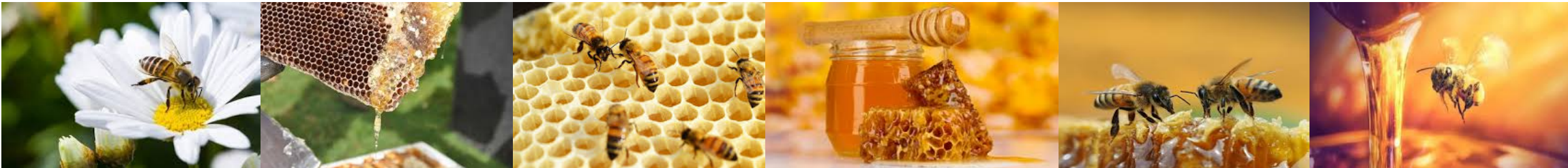
INDICADORES DA CADEIA DO MEL DE ABELHA (2018 - 2024)